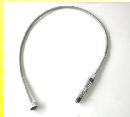
専用フレキシブルシャフト