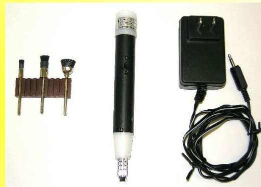
構成品一式 (本体、ブラシ、ACアダプター)